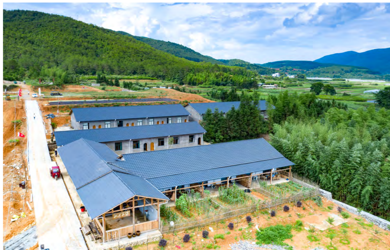
林畚初心小镇住宿区

单间70间, 商务套房10间, 标准双人间45间, 有分别可容纳100、200、1000人的会议室