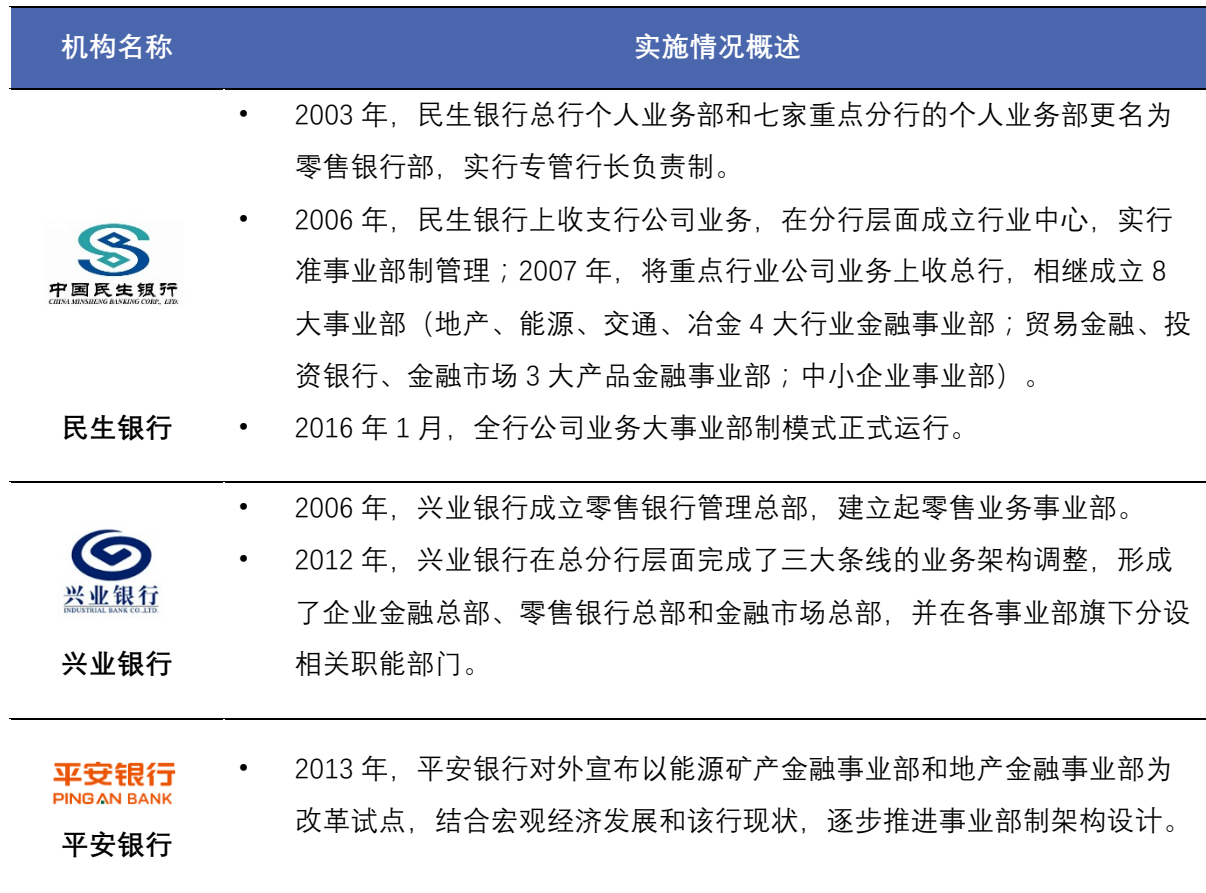
表 2 大型股份制银行事业部制实施情况概述

股份制商业银行由于体制较灵活，机构层级较少，资源充足，综合能力较强，往往自上而下地推动条线型事业部制整体改造。通过区域和业务战略经营单位的有效结合，提高决策效率和对市场的反应速度。