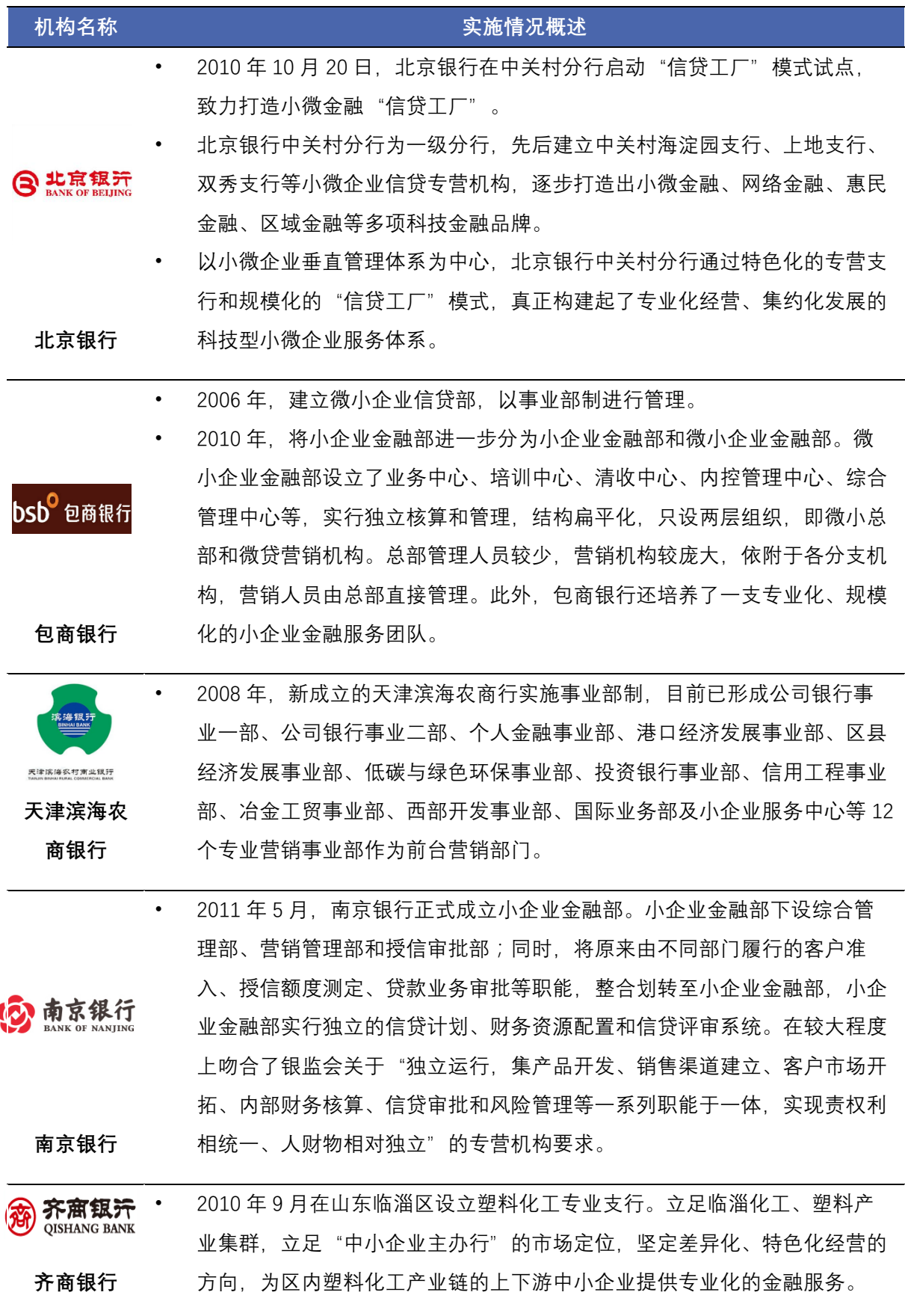
表 3 城市商业银行事业部制实施情况概述