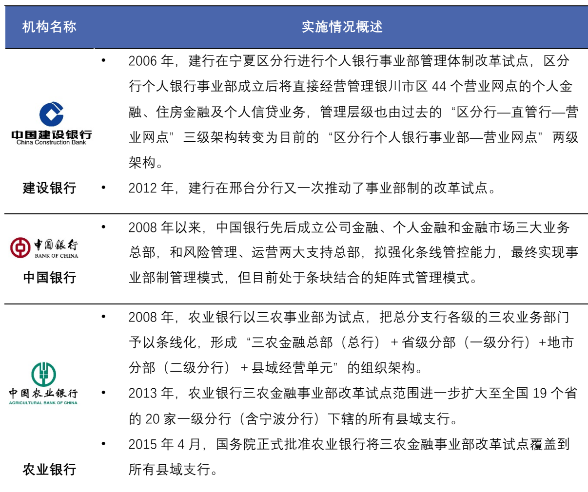
表 1 国有银行事业部制实时情况概述

国有银行管理层级多，链条长，改革将涉及到各部门和分支机构现有利益的调整，很难立即实现从总行到县支行的业务线垂直管理。各国有银行通常避开传统业务部门，率先对新兴市场业务(如投资银行、私人银行业务等)进行事业部制改革。