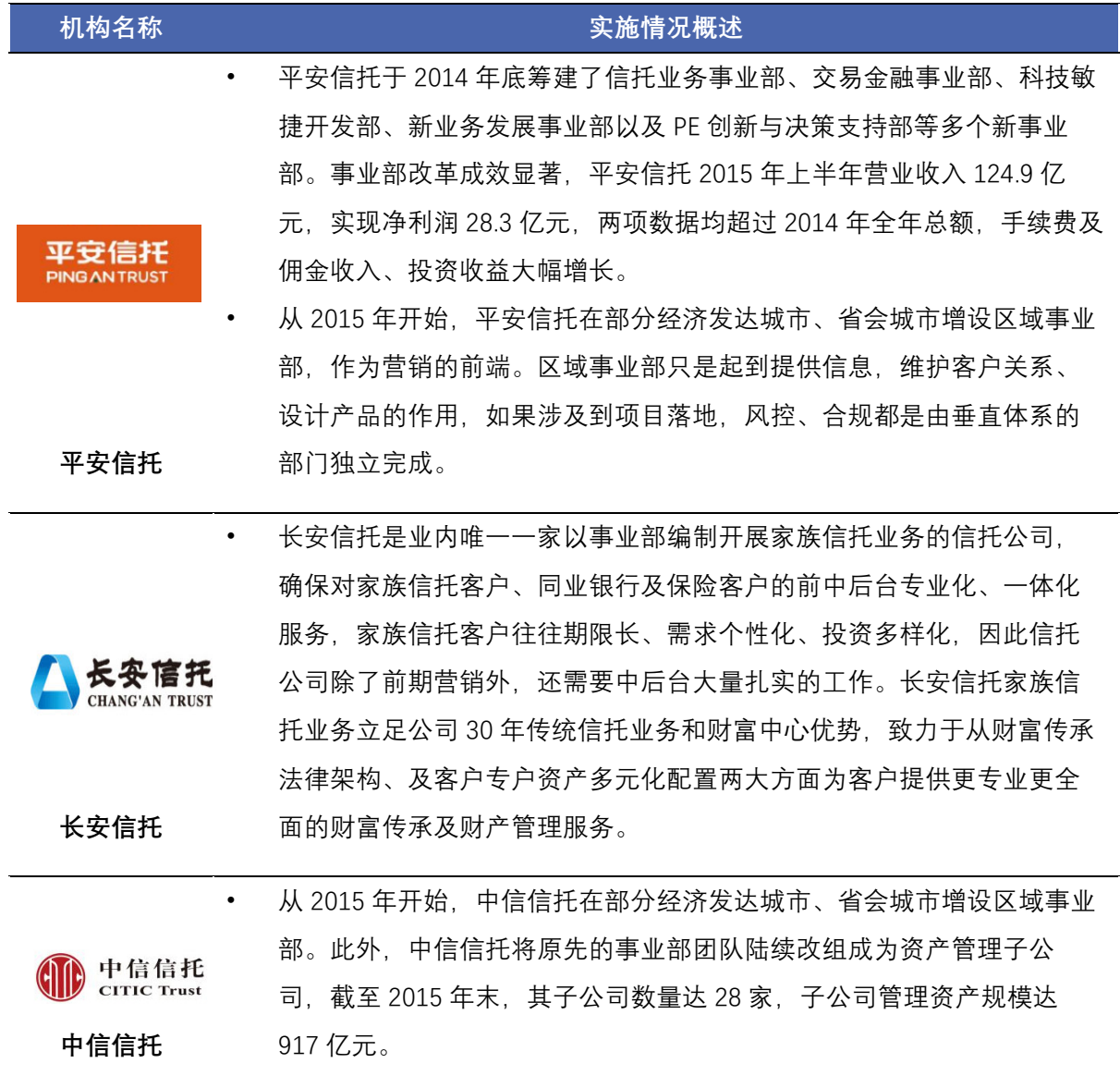
表 6 信托公司事业部制实施情况概述

众多信托公司在不同业务领域也实践了事业部制。最近两年来，设立区域事业部、财富中心已经成为信托行业扩张的一种方式。行业领先的信托公司正将原先的事业部团队陆续改组成为子公司，向金融控股平台公司转型。